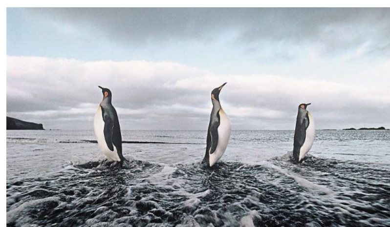
Des manchots royaux sur l'archipel Crozet, qui fait partie des Terres australes et antarctiques françaises, dans l'océan Indien.