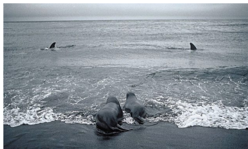
Xavier Desmier a obtenu le prix World Press 1998 pour ce cliché pris sur l'archipel Crozet dans l'océan Indien. Deux jeunes éléphants de mer face à deux orques au loin.

canal Érié. Le vieux gréement servira ensuite pour la pratique de la voile. « L'idée m'a séduit. Mon rôle sera de photographier les étapes importantes du projet et je compte bien faire la traversée même si ça s'annonce sportif sur une coque ouverte et des mers difficiles que je connais bien », précise Xavier Desmier. Ses premiers clichés, il les réalisera prochainement, quel que part en Pays de la Loire où sera abattu le premier chêne qui servira à fabriquer le navire.